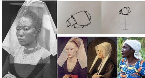
links: Flandria, rechts: het mystieke strijdhelm van Flandria

Vlaanderen evolueert naar een superdiverse samenleving, waarin hybriditeit centraal staat. Vlaamse culturele symbolen moeten volgen. Ik recycleer daarom gekende Vlaamse symbolen op een respectvolle manier, geeft ze een nieuwe invulling en functie. Gebaseerd op Hendrik Conscience's historische Roman 'De leeuw van Vlaanderen' laat 'FLANDRIA' de profetie van de zwarte leeuw op het gulden veld (de Vlaamse vlag) in vervulling gaan. Een Congolese prins met Vlaamse roots maakt zijn intocht in Vlaanderen, bestrijdt het Vlaamse Integratiemonster (de personificatie van de Vlaamse integratieproblemen) en sticht een Vlaams Congolees koninkrijk. FLANDRIA maakt deel uit van een veel groter kunstproject: 'Koning Lion I van Vlaanderen versus het Vlaamse integratiemonster'. Dit volksverhaal ontwikkelt zich binnen een liefdesverhaal tussen Koning LION I (die Kongo symboliseert) en Flandria, de patroonheilige van de Vlaamse natie. Lion en Flandria zijn hybride wezens.